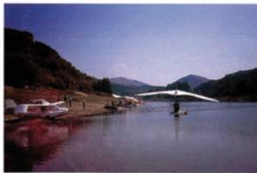
Voilà ce que ça donne! Tout ce qui se fait en U.L.M. hydro réunit sur une lace d'étude semi-avancée.